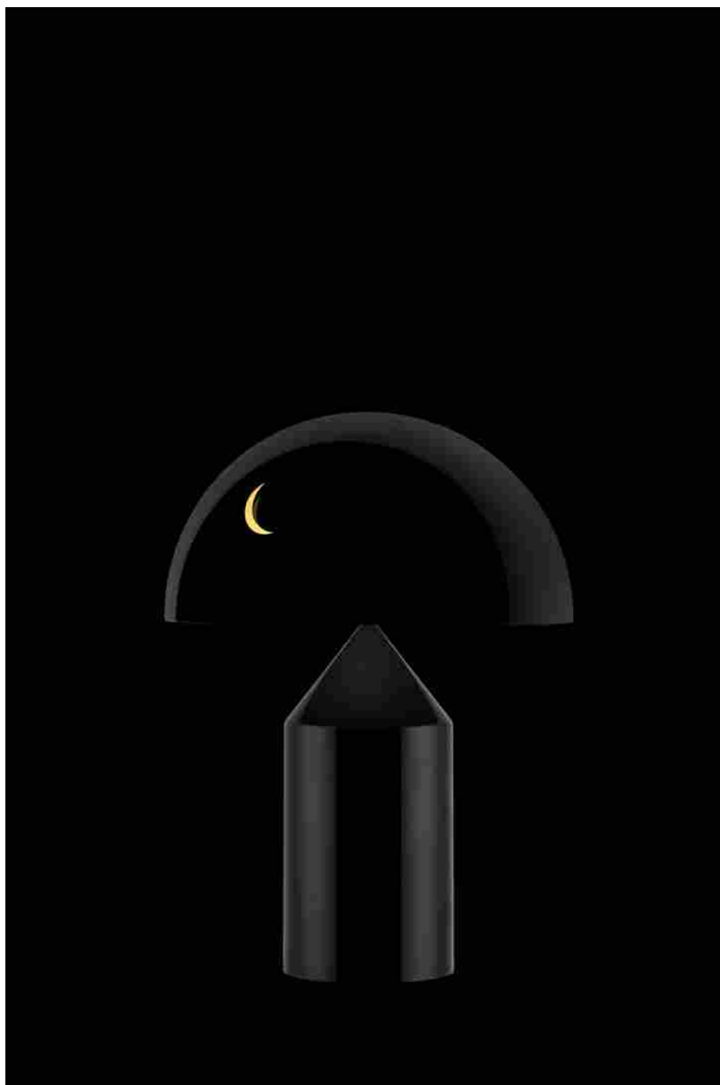
Omaggio alla Atollo di Vico Magistretti -Ettore Spalletti