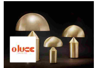
Oluce ATOLLO - 233/238/239