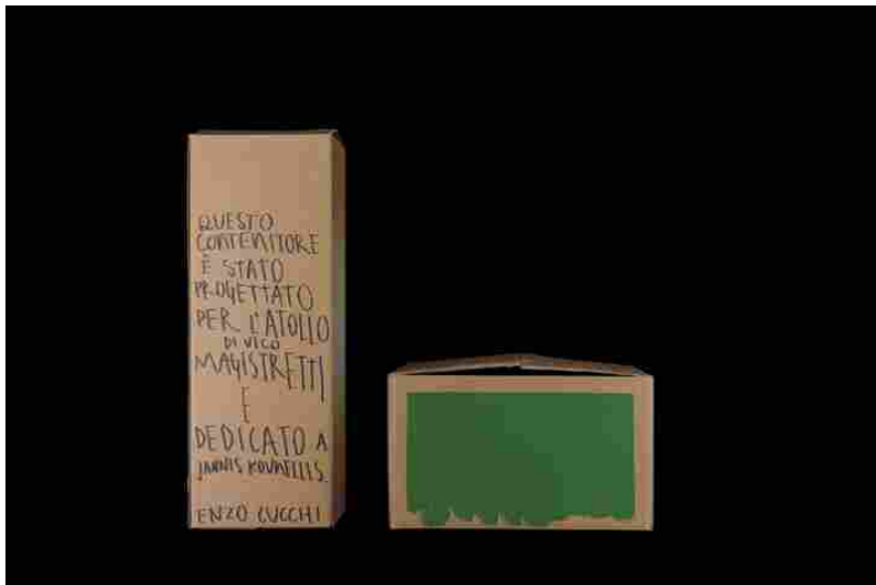
Omaggio alla Atollo di Vico Magistretti -Enzo Cucchi

Lavori unici, senza eguali, che nell'insieme compongono una riflessione squisitamente artistica. Lavori capaci di farci comprendere appieno e in maniera magistrale la complessità di una forma e, nel contempo, le problematicità del mondo che la circonda.