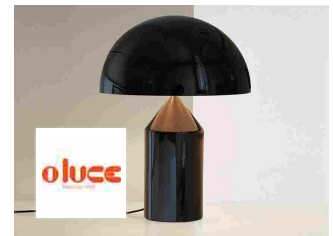
Oluce ATOLLO - 233