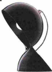
👁️ [DALÙ] ANNO: 1969 AZIENDA: Artemide «È difficilissimo fare le cose semplici. Le cose semplici sono il risultato di un'estrema complessità» diceva Vico. Dalù è così, ancora in produzione in diversi colori solidi e trasparenti.