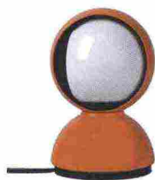
👁️ [ECLISSE] ANNO: 1965 AZIENDA: Artemide Soprannominata in un primo momento 'Scottadito' perché la mezza calotta girevole si surriscaldava, la sua concezione rimane geniale. Ha vinto il Compasso d'Oro nel 1967.