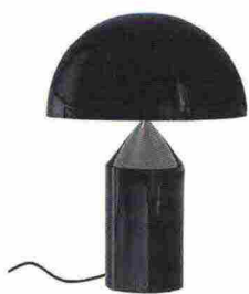
👁️ [ATOLLO] ANNO: 1977 AZIENDA: Oluce Sembra una composizione tra solidi geometrici, in realtà la forma di Atollo risolve un problema tipico delle abat-jour che 'schiacciano' la luce a terra troppo rapidamente.