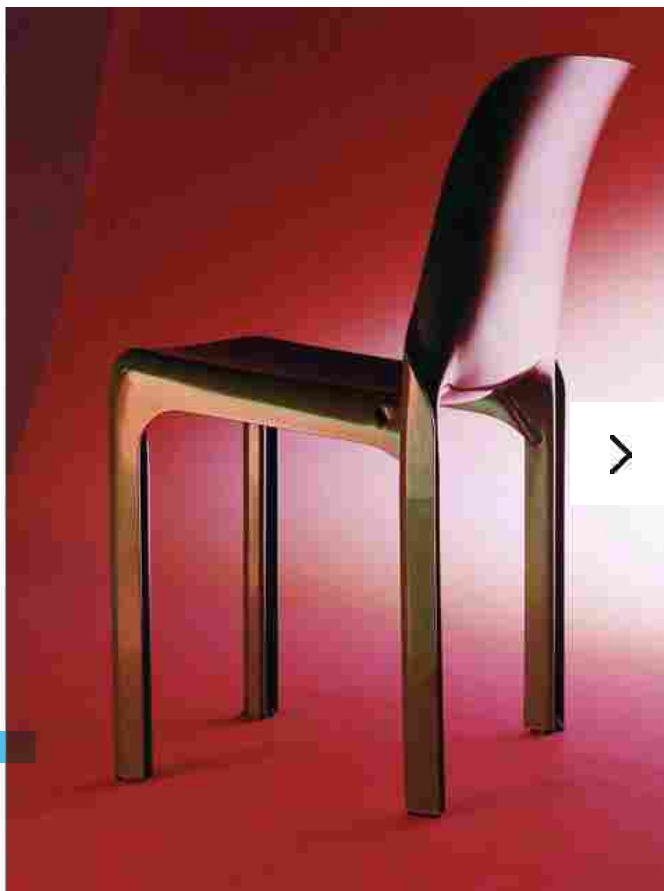
A sinistra, foto di Nicolas Polli, sedia Pan, Rosenthal Studio-Linie, 1980. A destra, foto di Calypso Mahieu - sedia Selene, Artemide, 1969