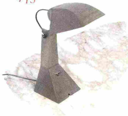
È in acciaio, rame e bronzo, la riedizione della lampada da tavolo E63, design Umberto Riva, di Tacchini. Sarà tra le novità del Salone del Mobile.