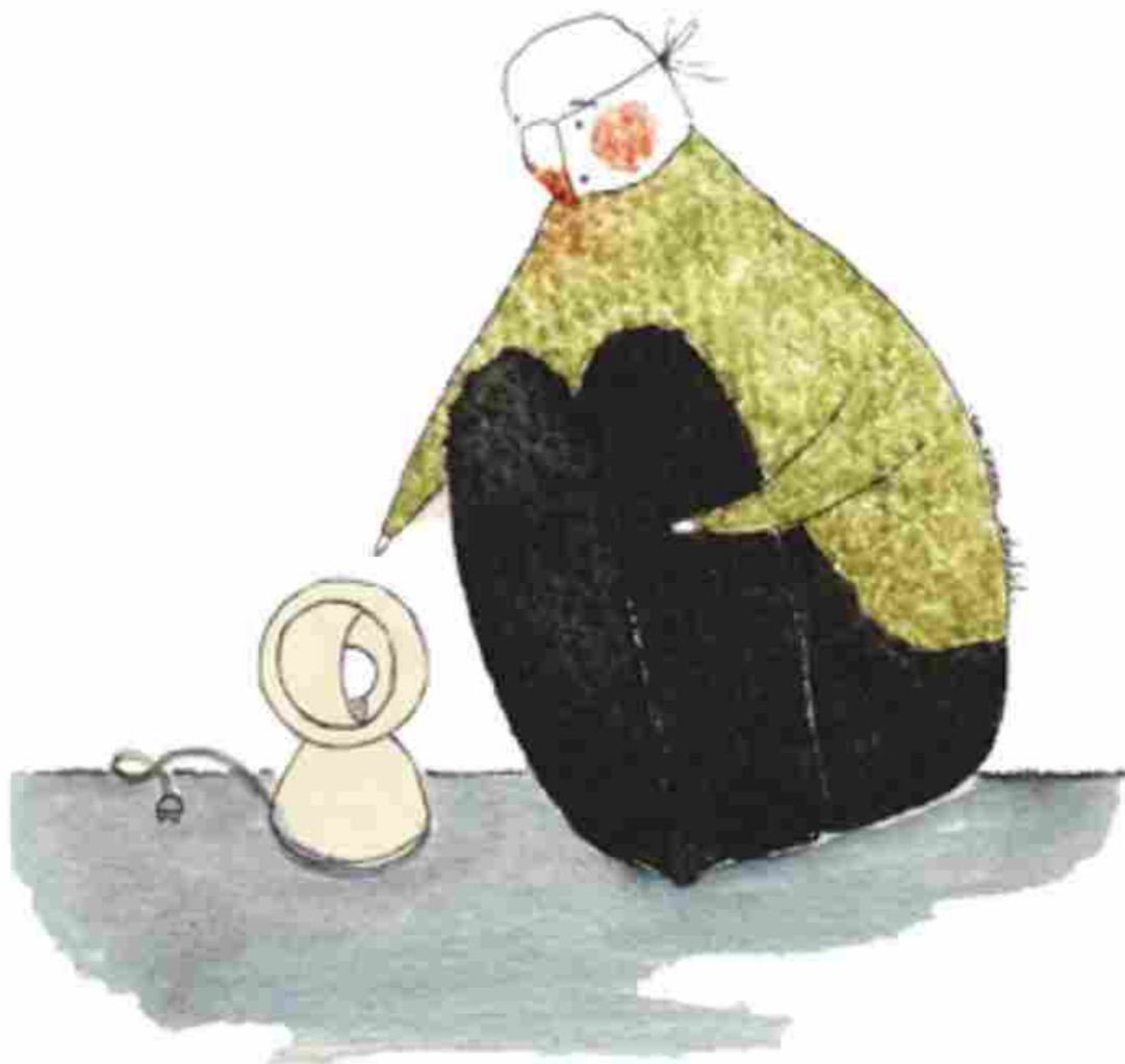
↑ Illustrazione di Eva Escoms Estarlich, Dilemma Eclipse