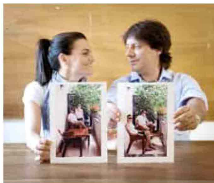
Sedia Gaudi e tavolino Arcadia, Artemide

Schizzo letto Ospite, Campeggi (1996)