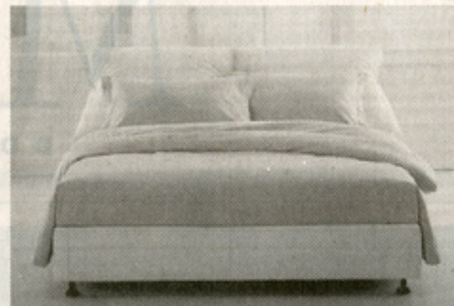
Il primo e il più diffuso letto tessile: è il «Nathalie» disegnato da Magistretti per Flou, tel. 0362.3731

«Non esiste, perché la casa è indissolubilmente legata al contesto che la circonda. Non amo Milano ma ci sono attaccato spiritualmente, quella che amo è l'Inghilterra, per la lingua, la civiltà, l'educazione, per il sistema di vivere dei suoi abitanti, con i soggiorni tutti eguali, nei loro caminetti, nella coppia di divani, nel tavolo posto nell'an-