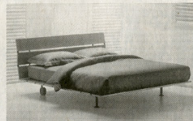
Più moderna e rigorosa la versione per dormire con l'impiego di semplici grandi listoni in legno. Si chiama «Tadao», sempre realizzata per Flou

golo. Una vera e propria sistematica dell'arredamento che fa assomigliare un po' tutti, ricchi e poveri».