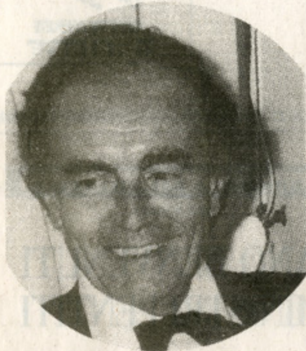
L'architetto Vico Magistretti